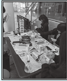
貸出備品の点検・清掃

こうした作業を毎月繰り返し行っているのです。私たちに とって保守点検日とは、利用者の皆さまに、安全に、安心して、 気持ち良くさくらホールを利用してもらうために必要な日な のです。(友)