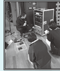
音響のレクチャー中

さくらホール館内レストラン Art cafe 桜都 TEL: 0197-65-5255 営業時間: 10:30~20:30 定休日: 月曜日