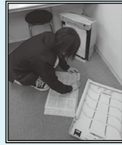
フィルターの清掃