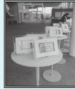
電波時計の日光浴