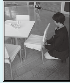
椅子カバーの交換