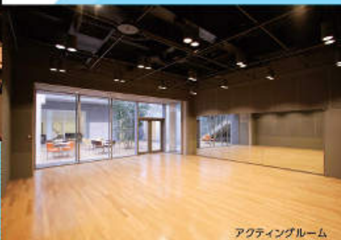
アクティブルーム