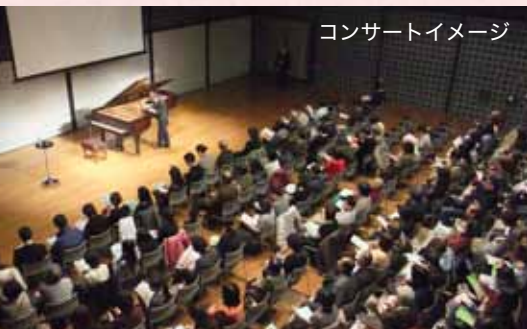
コンサートイメージ

※就学前のお子様のご同伴・ご入場はご遠慮ください。「予約制有料託児サービス」をご利用ください。 ※車椅子をご利用のお客は、さくらホールまでご連絡ください。 ※やむを得ない事情により、出演者が変更になる場合がございますので、予めご了承ください。